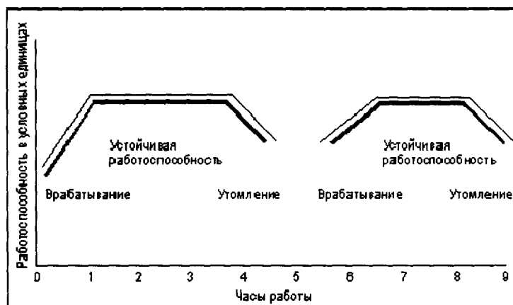
Рис. 2. Фазы рабочего периода 3